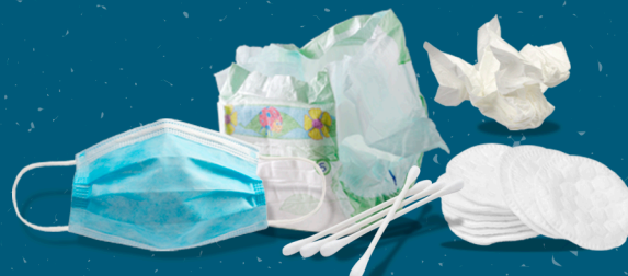
PRODUITS D'HYGIÈNE OU SOUILLÉS HYGIENE OR SOILED PRODUCTS