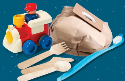
PETITS OBJETS EN PLASTIQUE SMALL PLASTIC OBJECTS